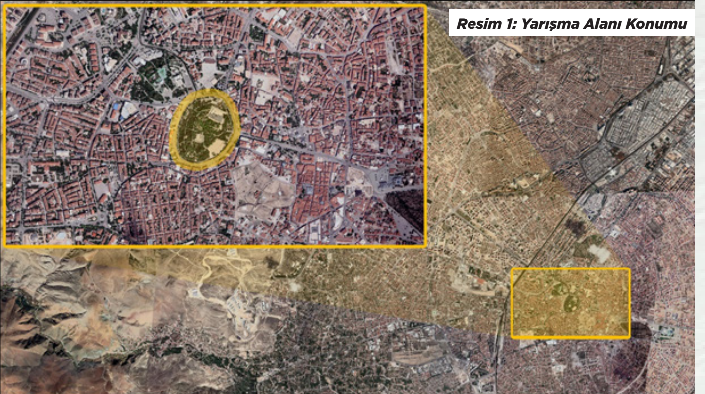
Resim 1: Yarışma Alanı Konumu

Şehrin tam merkezinde yer alan höyük, yüzyıllar boyunca bu bölgede yaşamış toplumlara tanıklık eder.