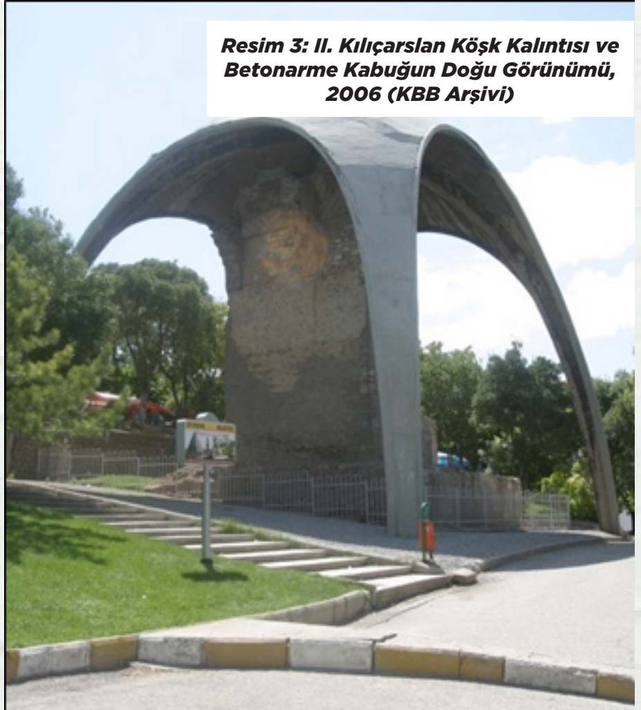
Resim 3: II. Kılıçarslan Köşk Kalıntısı ve Betonarme Kabuğun Doğu Görünümü, 2006

“Konya Alaeddin Tepesi, II. Kılıçarslan Köşkü ve Kazı Alanı Mimari Fikir Projesi Yarışması” ile köşk kalıntısı ve arkeolojik kazı alanında ortaya çıkan sur kalıntılarının gelecek nesillere aktarılmasının yanı sıra önerilen projeler ile Alaeddin Tepesi'nin kentle entegrasyonunun yeniden sağlanması amaçlanmaktadır. Yarışma ile köşk kalıntısı ve arkeolojik alanın kentsel, mekânsal, tarihsel ve özgün değerlerinin ortaya çıkarılması ve bu değerlerin görünür kılınması, kentli ile kentin sahip olduğu kültürel miras arasında bağ kurulması istenmektedir. Kentli üzerinde oluşturulan farkındalık ile kentin bu bölgesinin kullanılabilir hale gelmesi ve alanın yeniden değer kazanması, kent için kültürel anlamda önemli bir merkezin oluşturulması hedeflenmektedir. Alaeddin Tepesi'nin kent belleğinde ve oluşumunda önemli bir yere sahip olması, kent merkezinde yer alan başta Mevlana Müzesi ve diğer Selçuklu dönemi eserleri ile ilişkili olması, alanın önemini arttırmaktadır. Bu nedenle düzenlenen yarışma çerçevesinde, dönemi yansıtan, alanı kentle bütünleştiren sahip olduğu değerleri ön plana çıkaran çağdaş ve yenilikçi anlayışta hazırlanmış öneriler ve fikirler beklenmektedir.